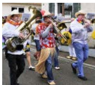
Die Stadtkapelle führte den Rosenmontagsumzug in Burkheim an (links). Das ...mehr