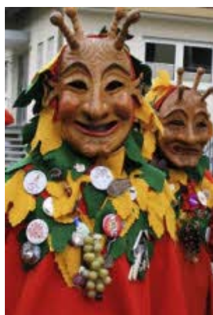
Die Burkheimer Schnecke durften beim Umzug nicht fehlen.